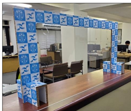
① 飛沫感染防止ボード

2. ダンボールパーテーション (「組み立て式」飛沫感染防止ボード) 枠は白段ボール、半透明フィルムを使用 幅 900mm、高さ 700mm 20 セット/1 ケース 東京都北区の「紙の博物館」でも販売中