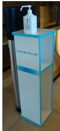
導入事例(御茶ノ水ソラシティ 1F 出入口)

6.消毒用高濃度エタノール製品 詰め替え用 720ml 入り(4合瓶)量が多めアルコール 70%と、最も殺菌効果のある濃度(60%以上で、厚生労働省が認可)懐かしいアルコール消毒液のにおいがします(飲用不可、酒税対象外)(次亜塩素酸水と違い)、消毒効果が何年たっても変わりません(ジェルタイプと違い)、長期の使用でも手荒れが起きません医療機関にて、頻繁に使われても、看護師の方の手荒れは一切起きなかったと好評です(日本橋浜町の浜町公園クリニック他) 12 本段ボール 1 ケースと 6 本入段ボール 1 ケースあり 1 本からのバラ売りも可 手提げ袋入り ※50ml 入り携帯用ミストスプレーも用意しました。