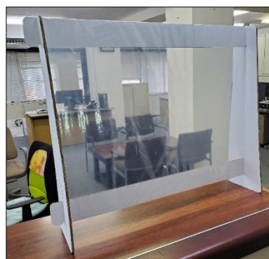
② ダンボールパーテーション